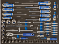
Vasos y destornilladores en foam 3/3 (60 piezas) IFF1A004