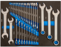
Llaves combinadas y llaves fijas en foam 3/3 (31 piezas) IFF1A006