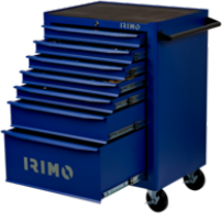
Carro con 7 cajones de 26" 9066K7