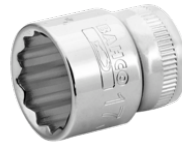
Vaso con cuadradillo de 3/8" con perfil bi-hexagonal de 19 mm A7400DM-19