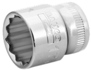
Vaso con cuadradillo de 3/8" con perfil bi-hexagonal de 13 mm A7400DM-13