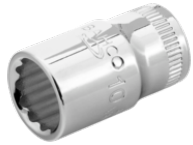
Vaso con cuadradillo de 1/4" con perfil bi-hexagonal de 6 mm A6700DM-6