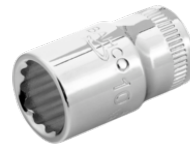
Vaso con cuadradillo de 1/4" con perfil bi-hexagonal de 13 mm A6700DM-13